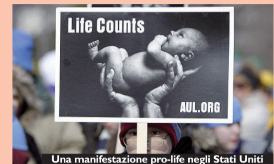
Una manifestazione pro-life negli Stati Uniti

Embrioni e aborto entrano nell'agenda delle presidenziali