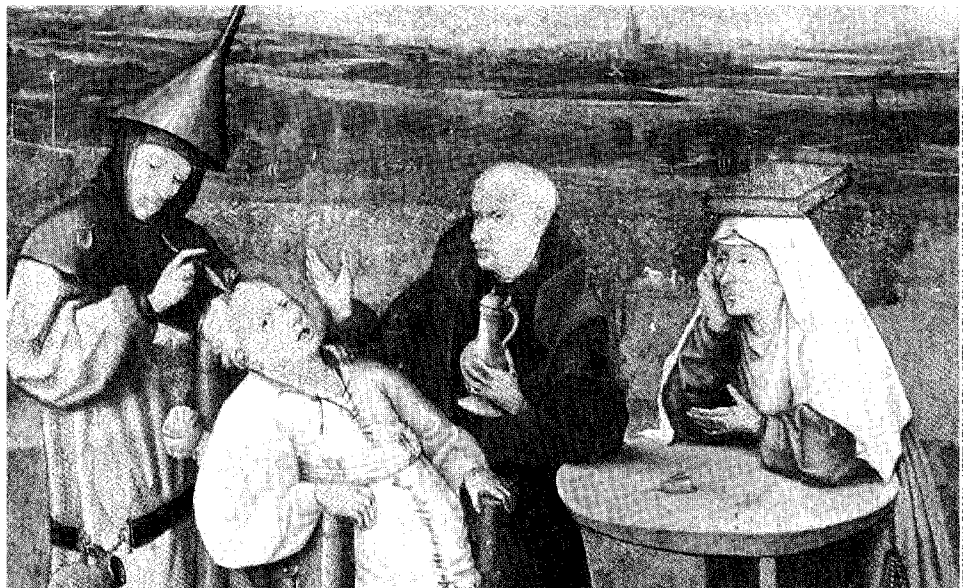
HIERONYMUS BOSCH, «L'ESTRAZIONE DELLA PIETRA DELLA FOLLIA», MUSEO DEL PRADO (PARTICOLARE)

Prima disturbi dei nervi causati da simpatie e antipatie tra gli organi che provocano sensazioni di freddo o di calore, sincopi e convulsioni; poi sofferenze dell'anima causate dal rapporto tra l'io e la società