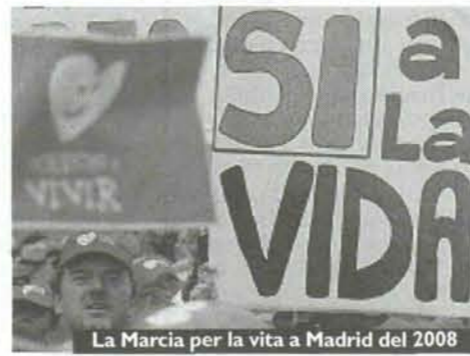
La Marcia per la vita a Madrid del 2008

per uno Stato laico e neutrale, di fronte alle discrepanze derivate dalle differenti credenze dei cittadini». L'unico voto contrario dei 12 membri del Comitato è stato quello dell'ex presidente del Consiglio superiore delle ricerche scientifiche, Cesar Nombela: è una «contraddizione» riconoscere che la vita inizia con la fecondazione e accettare la possibilità di «mettervi fine in modo volontario», ha spiegato. Un recente sondaggio rivela che alla maggioranza degli spagnoli la riforma non piace: l'autonomia garantita alle minorenni per abortire senza comunicarlo a madri e padri è il capitolo che più critiche ha suscitato, anche all'interno del Partito socialista di Zapatero. Contro il disegno di legge il 17 ottobre scenderanno in piazza a Madrid centinaia di migliaia di persone; gli organizzatori sperano di superare il milione e mezzo di partecipanti.