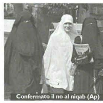
Confermato il no al niqab

dipendenti dall'università. In un comunicato, emesso nella giornata di ieri, il consiglio supremo dell'istituzione ha affermato di aver deciso di «vietare a studentesse e insegnanti di indossare il niqab durante i corsi frequentati da donne e tenuti unicamente da insegnanti donne». Sembra tuttavia che lo stesso velo possa essere portato all'interno delle case, per strada e nel cortile delle scuole. Secondo la stessa nota, l'obiettivo del divieto è di diffondere lo spirito di fiducia, condivisione e comprensione tra insegnanti e studenti. È stato inoltre deciso di proibire alle studentesse di indossare il velo integrale nelle sale in cui si sostengono esami dove non è prevista la presenza di uomini.