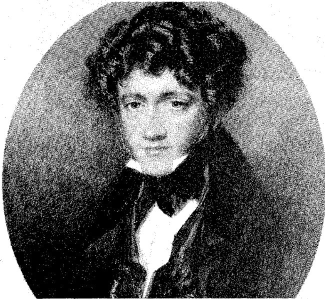
L'astronomo: William Herschel (1792 – 1871)