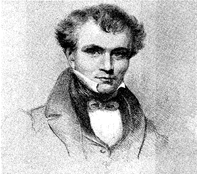
Il filosofo e il geologo: William Whewell (1794 – 1866)