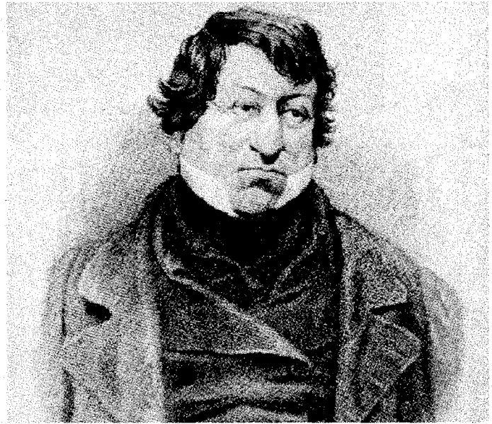
L'economista: Richard Jones (1790 – 1855)