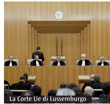
La Corte Ue di Lussemburgo

etici. Da questo punto di vista c'è da registrare il fatto che durante l'ultima sessione del Parlamento il commissario Michel Barnier ha affermato che i servizi della Commissione non hanno ancora valutato appieno le conseguenze politiche di questa sentenza». Si parla oggi molto di diritti umani: come considerare la decisione della Corte? «La sentenza è pienamente basata sui diritti umani, che proteggono la vita, e che non possono operare nessuna distinzione tra il periodo prima e dopo la nascita. Non ci può essere alcuna discriminazione basata sulla nascita. Gli Stati hanno il fondamentale obbligo di proteggere la vita nel corso di tutta l'esistenza dell'essere umano. Questo obbligo nasce dalla responsabilità di difendere la propria popolazione, che è una condizione centrale per la legittimità di uno Stato».