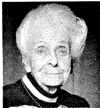
Rita Levi Montalcini

PREMIO NOBEL PER LA MEDICINA NEL '75, DOPO LA GUERRA SI TRASFERISCE 33ENNE NEGLI STATI UNITI , PRIMA A BLOOMINGTON, POI AL CALTECH , AL SALK INSTITUTE E INFINE ALL'IMPERIAL COLLEGE DI LONDRA . DAL 1986 SEGUE IL PROGETTO GENOMA . HA 97 ANNI