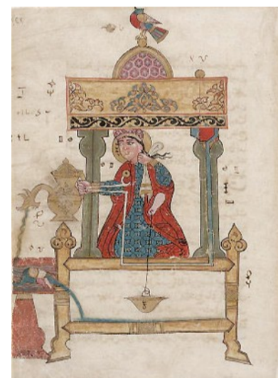
A destra, il fisico Jim Al-Khalili. Nelle altre foto, le macchine dell'inventore arabo medievale al-Jazari: automi musicali, per lavare le mani e da tavola