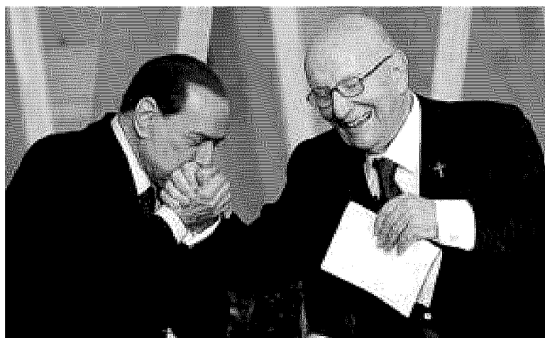
Il premier fa il baciamano all'amico don Verzè